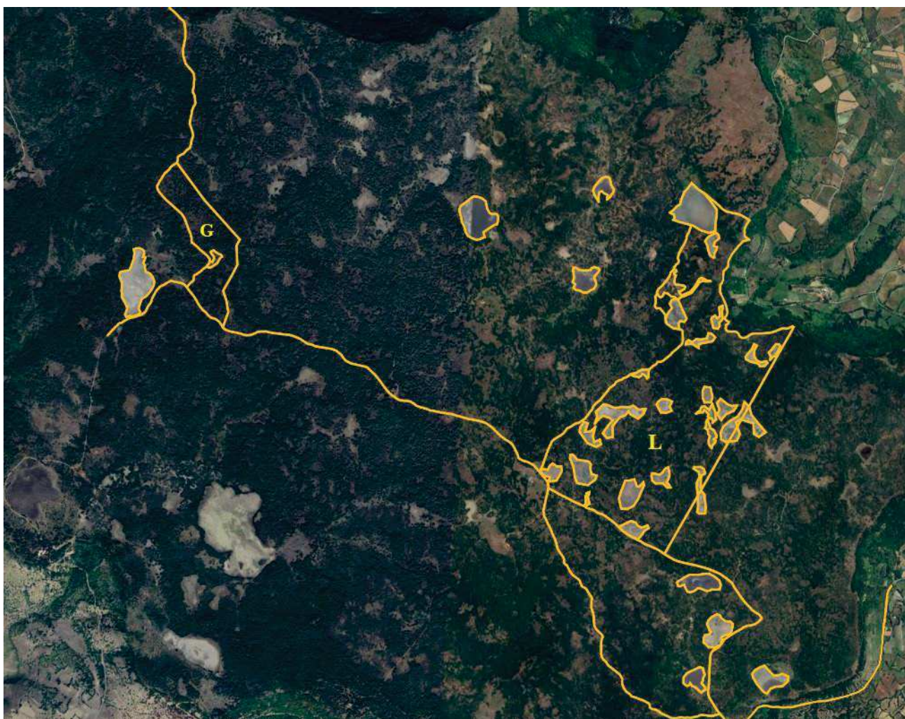
Rappresentazione cartografica del LOTTO G (parte) e del LOTTO L (intero)