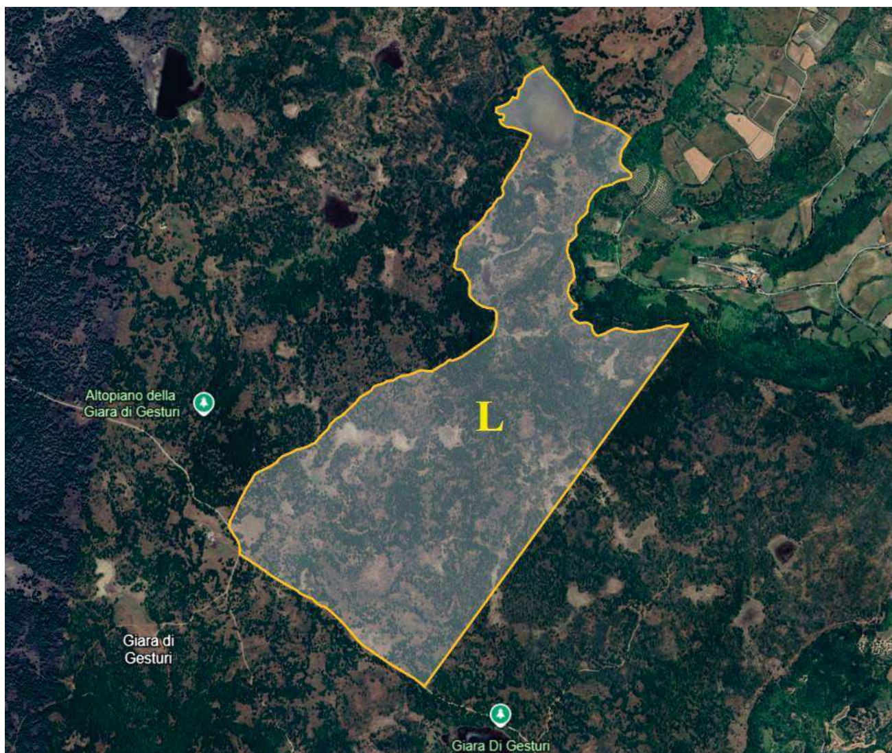
LOTTO L (delimitazione perimetrale)