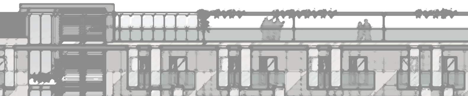
TAVOLA 5 Schema funzionale primo livello interrato