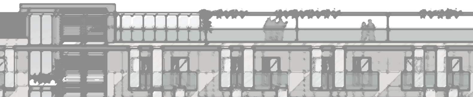
TAVOLA 6 Schema funzionale secondo livello interrato